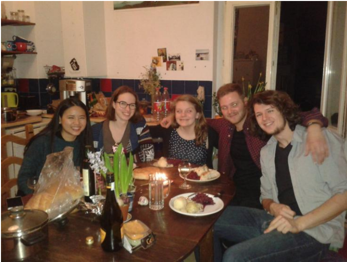
在對我很好的德國女孩家中吃飯道別

有個點心趴，或是亞洲料理趴，大家一起煮菜邊聊天的感覺更能增進感情。天氣還不會很冷的時候也可以約三五好友去參加柏林各地的活動。很常會有某國的 street food market 或是二手市集，逛一逛在附近的啤酒花園和朋友喝酒再好不過了！