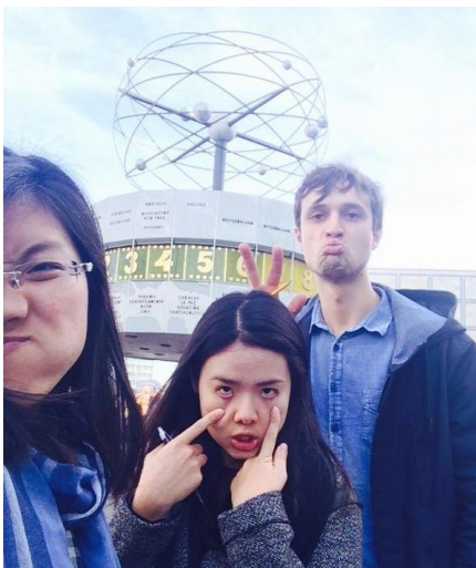
最後一堂課的校外探索紀錄

那時候覺得人生有點光明，因為我們班是基礎班，大家都不會德文，完全可以理解對方這幾天當文盲+半啞巴的慘況。我們很幸運地遇到非常親切又會教的老師，而且我們班同學都很合拍，那個月每天都過得很充實。9、10 月時柏林天氣還算很好，我們下課就會一起吃飯或是在附近公園一起散步聊天。