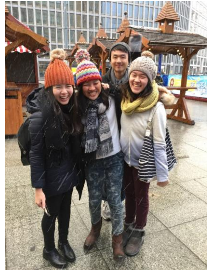
聖誕市集中迎接第一場雪

位於歐洲中心的德國，飛往鄰近國家也是假期的好選擇。歐洲的廉價航空非常多，只要注意行李限制和登機手續，其實跟一般航空不會差太多。德國火車非常舒適，速度也蠻快的，當然價錢也會高很多。火車跟機票一樣都會隨著日期靠近而慢慢提高價錢，如果提早訂可以省2-4倍差非常多。巴士就很多選擇而且價錢都常都不高，可是有時候會開很久才停，而且一停就會停個半小時。有一次我還跑錯巴士月台，幸好問到好心人幫我處理換票的問題。