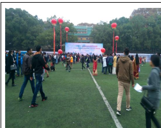
圖十三:武漢大學國際文化節實景