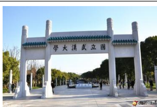
圖七:武漢大學牌坊

武漢的天氣只有夏、冬兩季，加上極短的春、秋季，與重慶、南京、長沙並列中國四大火爐，武漢的熱是連非洲留學生都受不了的那種，當時看新聞說，非洲留學生暑假紛紛回家，受不了武漢的天氣比非洲還熱，我是 9/5 去的，當時白天還能到 25 度，晚上降到 15、16 度，每天溫差都是 10 幾度的那種，這種情況維持的 2 個月，大概要到 11 月才進入秋冬季，那是瞬間會降到 10~15 度的，武漢的秋冬季會下雨，但不像台北下的這麼頻繁，也不會下得這麼多，都是綿綿細雨，常常起霧，望眼看去，整座校園都瀰漫的大霧，呈現出朦朧美，實在是很難忘的體驗。再來就是雖然大陸不像台灣有很多 7-11，但買東西卻完全不用擔心，因為學校有很多自強超市，很像全聯福利中心，裡面什麼都有賣，也可以刷校園卡，然後是校區，武漢大學分為信息學部跟文理學部，這兩個校區沒有連在一起，但也不會隔很遠，學校校巴挺方便的，投幣 1 元，刷卡 0.6 元，有分 4 條路線，第一條是工學部，我比較不會坐到，第二條是文理學部，也是最多人乘坐的一條線路，它經過教五、湖濱、楓園、經管院，行政樓，考試中心(未經行走順序描述)，第三條是大循環，顧名思義就是全校都有經過，但相對的班次也比較少。交通方面，武漢的地鐵很方便，也就是捷運，坐到最遠也只要 5 RMB，市區公交(公車)也很方便，唯獨就是師傅(司機)開車普遍都很兇，都很喜歡按喇叭(我去上海叭的更兇，可能是全中國司機的通病)，最後是飲食，武漢食物偏鹹又偏辣，重點是很辣，辣又分兩種，一種是麻，一種是辣，剛好武漢又麻又辣，去武漢必吃的名產-周黑鴨(滷味)，最出名的是鴨脖，就是又麻又辣，可以嘗試看看，走在路上，很多人提著一盒又一盒的，至少 6 盒不誇張，有一句話是這樣說的，全中國的鴨脖，有 1/3 都是武漢人吃掉的，可見有多喜歡吃鴨脖。