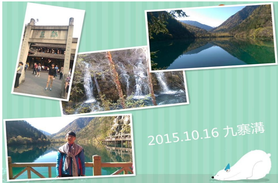
圖十七:九寨溝遊玩組圖