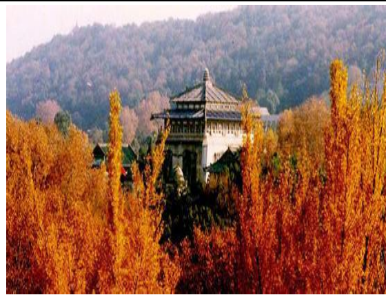
圖十:武漢大學楓葉盛況