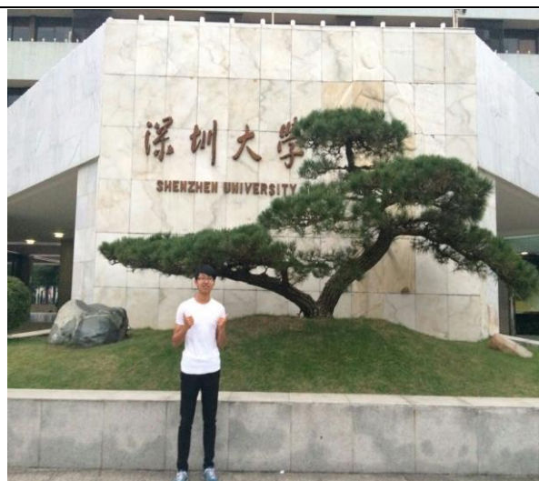
圖十六: 去深圳大學交流