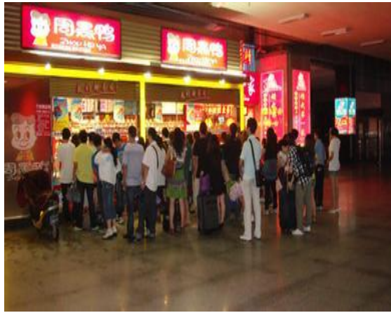
圖十一:武昌車站周黑鴨排隊人潮