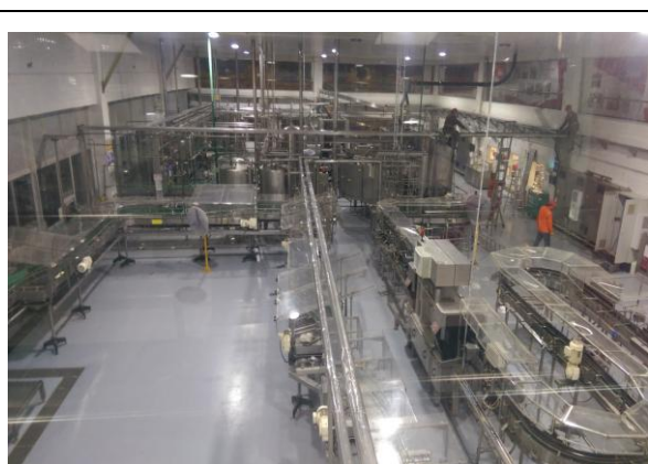
圖六:可口可樂生產線實景圖