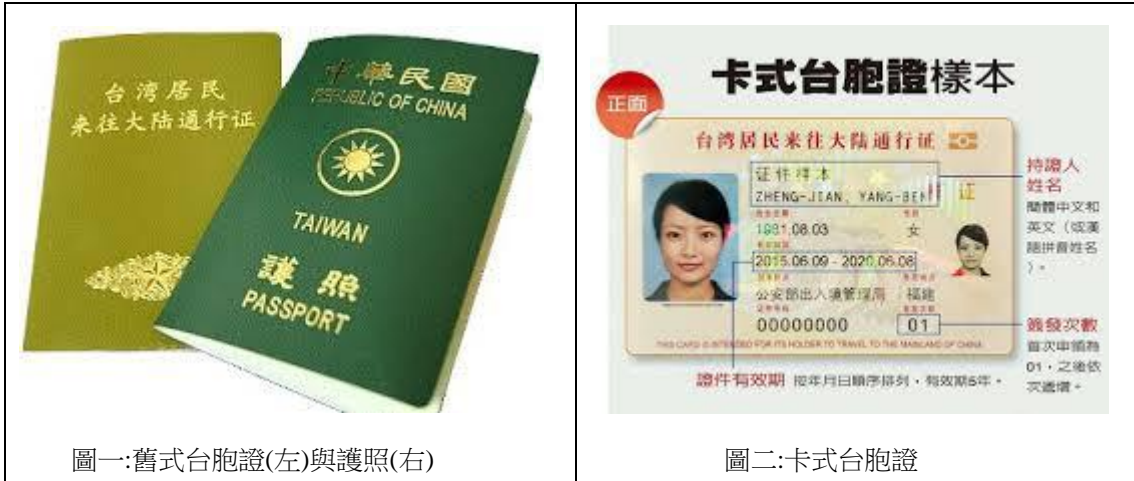
圖一:舊式台胞證(左)與護照(右)