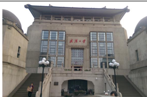
圖八:武漢大學老圖書館