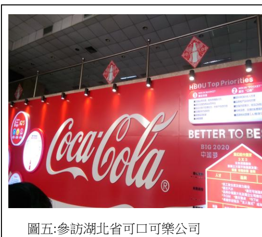
圖五:參訪湖北省可口可樂公司

武漢大學的社團、活動非常的多，常常會在桂園、楓園、湖濱、信部，舉辦各式各樣大大小小的活動，也有外面的補習班提供升學、留學的諮詢，還有「掃一掃，送贈品」，這算是他們的行銷手法，為了增加知名度，他們會請你用 QRcode 掃一掃，接著關注他們的官方網站，算是跟台灣不一樣的行銷手法，大陸都用 QQ 和微信，所以他們都會叫你關注他們的官方帳號，如果要留個人的信息，大多都會叫你留 QQ 號。我沒有參加他們的社團，首先，我是到 11 月才有人傳微信跟我說你來武大交換被分到「工管一班」，他才傳了武大助手、武大官方帳號，以及他們班的 QQ 群跟微信群給我，在這之前的活動我都没參與到，但也不是完全沒有參與到課外活動，像是武大的講座其實非常的多，再加上我時間蠻充裕的，就參加了蠻多的講座，但是，我發現講座雖多，但不是每一個都值得去聽，有些是辦個形式性的，或是有些雷聲大、兩點小，專門講主講人的聲名事跡，這種就是形式大於實質意義。另外，我是上學期去的，適逢中秋節，港澳台辦事處有辦「中秋狂歡派對」，10 月中還有個「交換學生出遊」，去的是恩施大峽谷，那交通費，住宿，都不用錢，可以好好把握機會，我就是剛好十月中有安排成都、九寨溝，可惜沒有跟上。