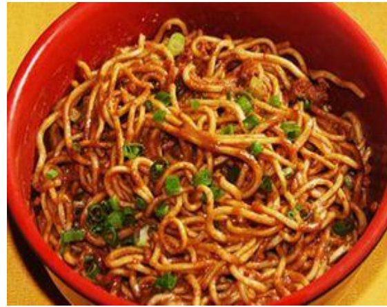
圖十二:武漢美食-熱乾麵