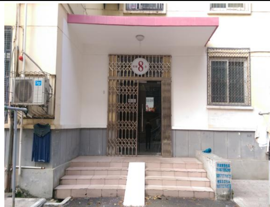
圖九:我住的內地生宿舍(桂園八舍)