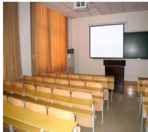
圖四:武漢大學教室(2)