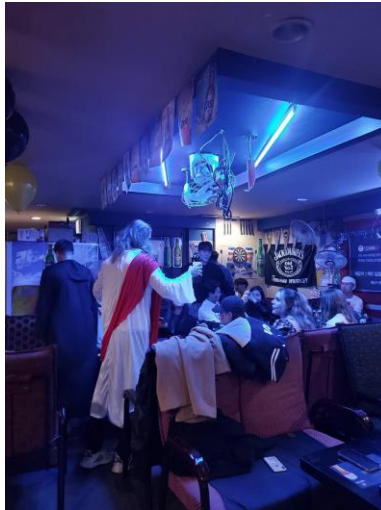
▲ SNUBuddy 萬聖節活動

【SNU Tutor&Tutee Program】：這個計畫是宿舍舉辦的，提供外國學生一學期的輔導計畫，參加此計畫為免費，與你配對成功的 Tutor 會輔導你的學業課程亦或是日常生活的問題，我配對到的是一位研究生的學長，這位學長同時擔任宿舍的助教，所以我們輔導的時候都是在他的宿舍辦公室，通常 Tutor 會跟你說一個禮拜需要上 4 個小時的課程，不過具體上如果上課你們可以自己協調。透過這個計畫我真的受到很多幫助，包括：語言交換、學業輔導、文化交流等，你可以跟你的 Tutor 聊天、上課、玩遊戲，基本上有能夠透過這個計畫再交到另一名好友的感覺，非常推薦參加！