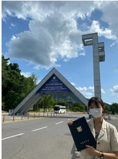
▲在首爾大門口與語學堂畢業證書合照