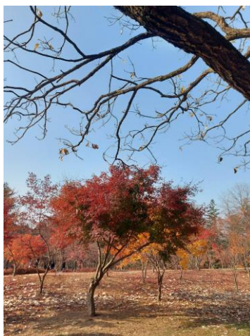
▲首爾大秋天的景致

【氣候】：首爾的天氣跟台灣不同，到了9月中、10月底左右就差不多涼涼的了，冬天更是要穿羽絨外套才不會冷，去年我在首爾的冬天，聽說是最大的雪，宿舍外的公車都停駛，因為雪下太大上不來。春天也比台灣來的更長，濕度也較乾。