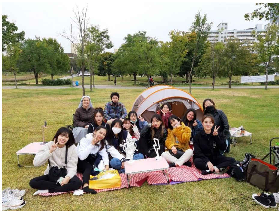
語學堂的文化體驗活動-漢江野餐