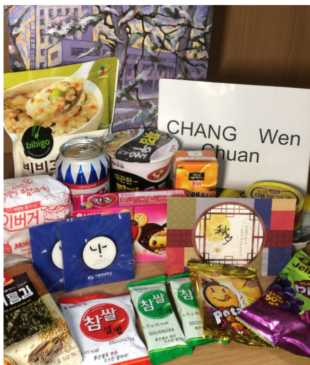
在歡迎會收到的禮物

我在韓國的這一學年因為疫情少了很多韓國大學生活的體驗，所以認識韓國人的機會不多，大部分的外國朋友都是在語學堂認識的，我遇到的其他外國同學有日本人、義大利人、美國人和中國人，大家都非常好相處，也都會互相了解對方國家的文化、課堂之外一起去吃飯逛街，是一個練習韓文的好機會。