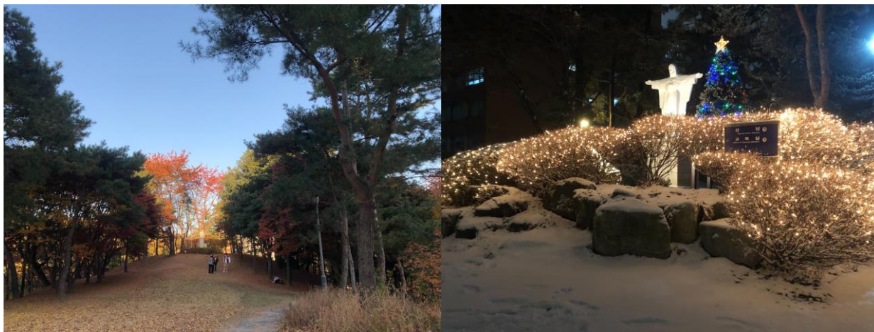
秋天與冬天的校園

對於交換這件事，雖然我自己也不知道在疫情期間繼續執行這個計畫是不是正確的選擇，畢竟光是因為疫情而多出來的花費就不容小覷，但我覺得人生如果有這個機會，還是很值得去的。對於學習語言來說，環境非常重要，而直接到這個語言的母語國家生活是最快的方式，在經過每周 20 小時的高強度韓文訓練，再加上日常生活中高頻率的使用韓文，讓我在這將近一年下來能感受到自己韓文程度的明顯提升，而去交換當然也不只是學習語言，體驗文化也是很重要的一件事，我想這一年我留下的回憶是能讓我在未來的日子回味很久的！感謝高雄大學和東語系提供學生許多交換的資源，讓我能夠去增廣自己的視野、培養自己適應環境的能力，如果人生有想要到國外生活一陣子的計畫，真的可以好好把握交換學生這個管道。