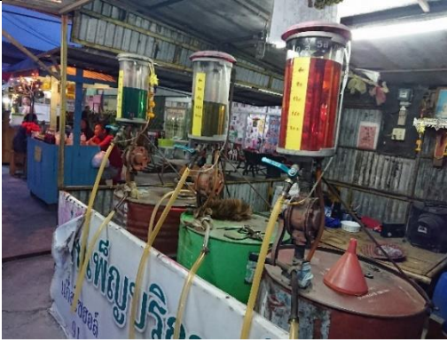
泰國鄉下地區加油站