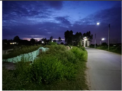
差點被狗咬的墓地