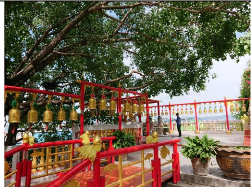
泰國廟宇內整排的鐘